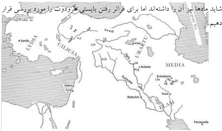
Map of the ancient Near East.

به نظر سانسسیسی روایت هرودوت در باره ماد، یک روایت ساخته یونانی از محدود داده‌های موجود از طریق بابل است. باید تأکید کرد که سانسسیسی-ویردنبورگ این ایده را که امپراتوری ماد مانند هخامنشیان بوده است، رد می‌کرد: او جنگ با لیدیا را به رسمیت می‌شناخت و هرودوت حکومت یا «امپراتوری» ماد را به عنوان موقعیتی که در آن می‌توان جنگ لیدیایی را آغاز کرده باشد، مطرح کرد، اما یک دولت ماد یا ساختار امپراتوری دیوان‌سالارانه را رد کرد. و از آنجا که او عمدتاً درگیر فرضیه‌سازی اکتشافی بود، بیشتر در مورد آنچه مادها نداشتند، دقت نمود تا در مورد آنچه داشتند. بلادرنگ، می‌توان مشاهده کرد که از آنجایی که او امپراتوری توسعه‌یافته هخامنشیان (آنچه که مادها نداشتند) را به عنوان ساخته دست داریوش می‌دید و از آنجایی که کوروش یک امپراتوری داشت، شاید مادها نیز آن را داشته‌اند اما برای فراتر رفتن بایستی هرودوت را مورد بررسی قرار