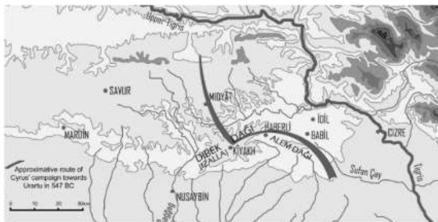
شکل ۱: نقشه‌ای که مسیر تقریبی لشکرکشی کوروش به سمت اورارتو را در سال ۵۴۷ پیش از میلاد نشان می‌دهد.

رادنر جغرافیای تاریخی این منطقه را با تجزیه و تحلیل وقایع‌نامه‌های پادشاهان آشوری که از آداد-نراری اول (۱۳۰۰-۱۲۷۰ پیش از میلاد) آغاز می‌شود، به تفصیل مطالعه کرد.